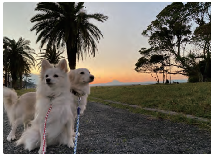
↑ 旅先でも変わらず、いつものお散歩を楽しめる

ベッドの上で添い寝ができたり、愛犬と一緒に BBQ を楽しめたり、お風呂も脱衣所までは愛犬も一緒に来れたり……。わんちゃん大歓迎の施設だからこそ、慣れない旅先で離ればなれになることなく、一緒に過ごすことができます。大事な家族だからこそ、みんなで楽しい旅の思い出をつくりませんか。