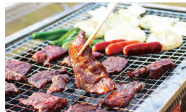
↑ BBQ を愛犬と一緒に楽しめる施設も