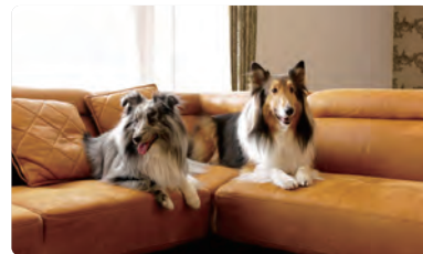
↑ 愛犬も過ごしやすく、家族みんなで居心地の良い旅