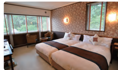
↑ 森の中の部屋で癒されるひとときを