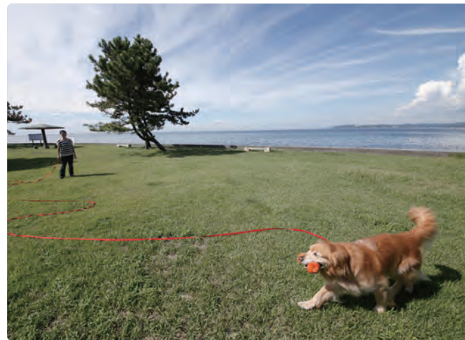
↑ 海辺の散歩で、愛犬と雄大な自然を満喫

いつもの家を離れ、愛犬と一緒にひとときの冒険へ。宿泊できる施設はいろいろも、自然豊かな環境にあります。海辺で夕日を眺めたり、高原のドッグランで遊んだり……。自然の中で楽しそうにしている愛犬の姿は、忘れられない思い出になることでしょう。愛犬の幸せそうな姿を写真や動画に残せば、旅から帰った後もずっと楽しめます。